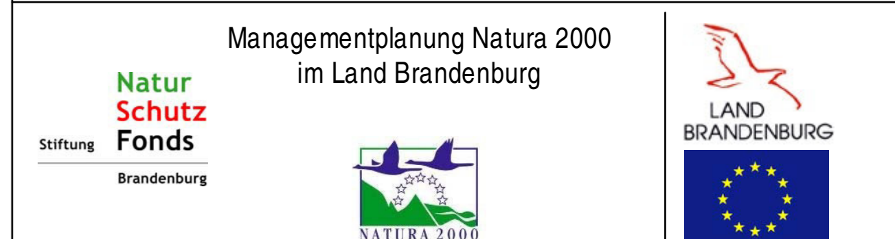
FFH-Gebiete 190 - Hutellandschaft Altranft-Sonnenburg, 597 - Cöthener Fließtal, 656 - Oderbruchrand Bad Freienwalde

II, IV = Anhang II bzw. IV FFH-Richtlinie EHZ = Erhaltungszustand (A: hervorragend, B: gut, C: mittel bis schlecht)