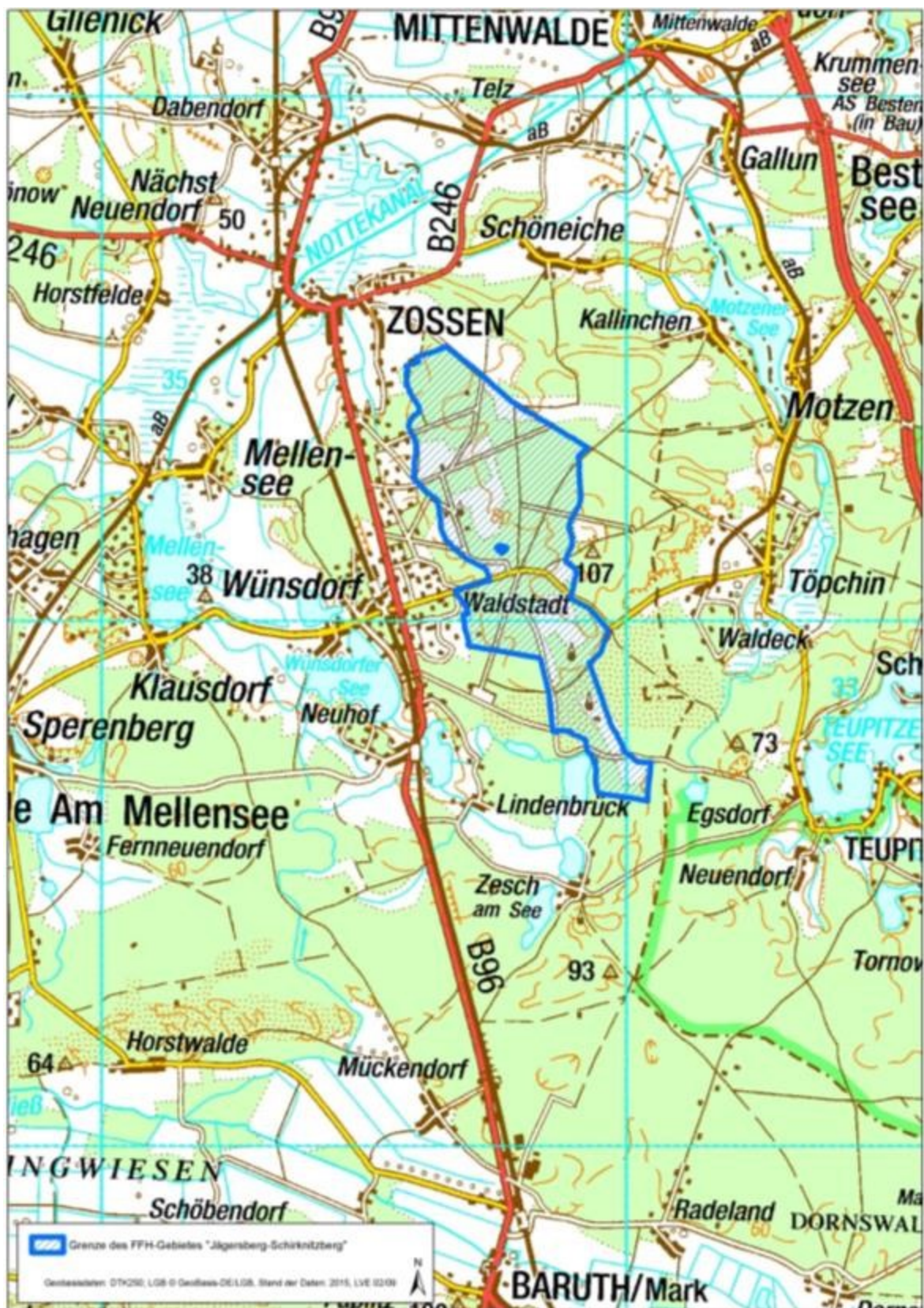
Abb. 1: Lage des FFH-Gebietes „Jägersberg-Schirknitzberg“