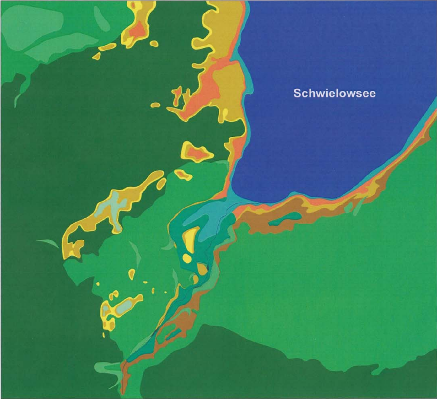
Abbildung 11: Waldzustand in der Eichen-Kiefern-Buchen-Zeit um 500 u. Z. (ursprüngliche Vegetation) [aus Rubin, M., Brande, A. & Zerbe, S. 2008]