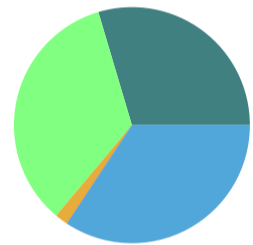
Verteilung der Belastungsgruppen in der FGE Elbe [%]