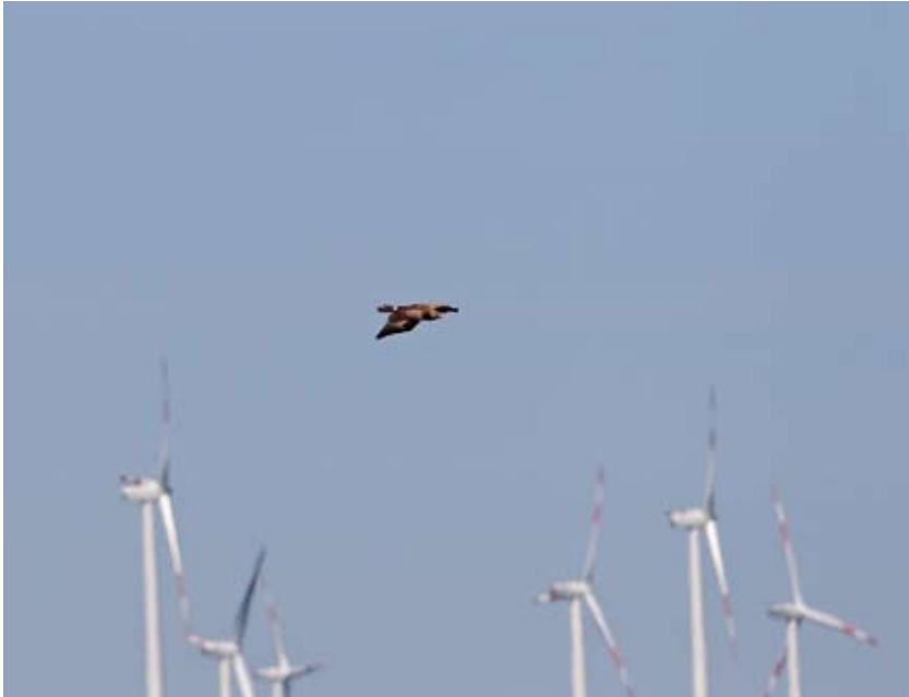
Der Schreiadler gilt als Repräsentant unzerschnittener und unverbauter Lebensräume. Die vielen Windparks in Nordostdeutschland tragen zur Gefährdung der letzten Vorkommen bei. Brandenburg, April 2011.