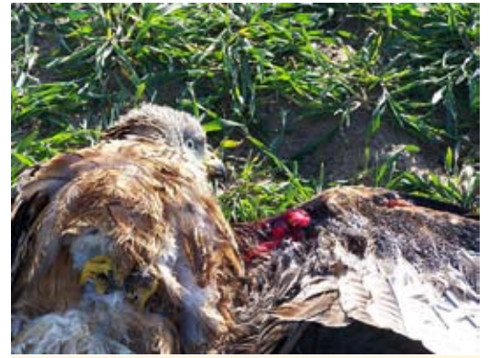
Vögel, die die Kollision überleben, wie dieser Rotmilan, können sich weit vom Unfallort entfernen.

Hellberge-Falkenberg, Brandenburg, 18.8.2012.