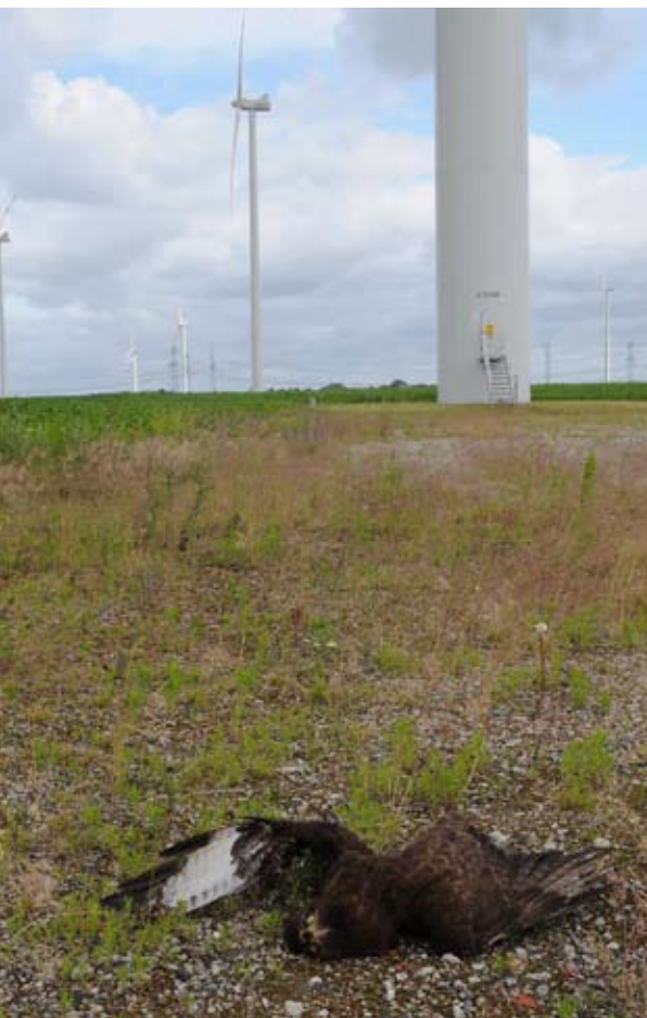
Der Mäusebussard führt die Liste der Kollisionenopfer an Windkraftanlagen in Deutschland an.

Es gibt jedoch eine Artengruppe, die weltweit in besonderem Maße von Kollisionen an Windrädern betroffen ist – die Greifvögel. Unter der derzeit in der deutschen Datenbank registrierten 1963 Kollisionenopfern machen sie 38% aus. Moment – in mehr als 13 Jahren Datensammlung nicht einmal 2000 Opfer? Wie kommt dann die eben erwähnte Zahl von 87 000 Vögeln pro Jahr zustande? Nun, die gemeldeten Zahlen sind das, was man die Spitze des Eisberges nennt. Sie setzen sich zusammen aus Zufallsfunden, stichprobenartigen