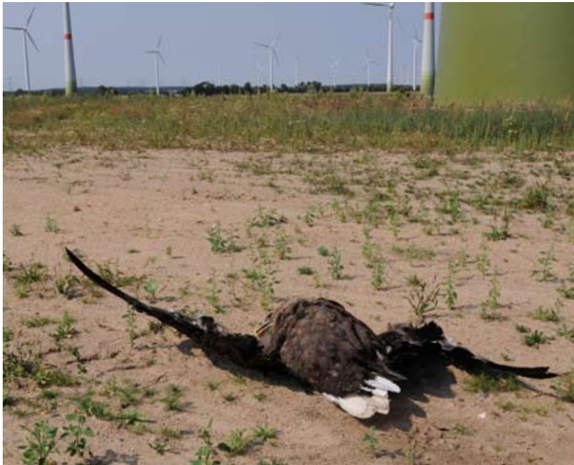
Seeadler als Kollisionsopfer unter einer Windkraftanlage.

Hellberge-Falkenberg, Brandenburg, 18.8.2012.