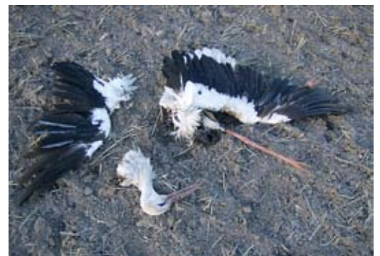
Nicht selten liegen die Teile eines Vogels weit verstreut.

Estorf, Niedersachsen, 17.10.2010.