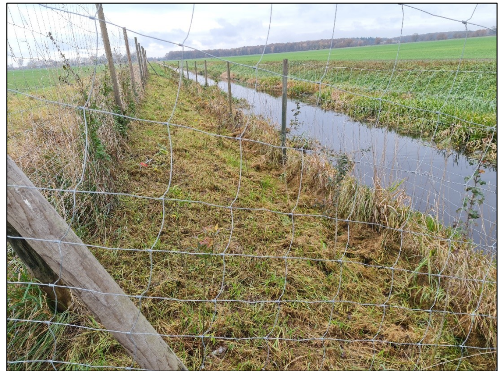
oben: Einer von vier Pflanzabschnitten