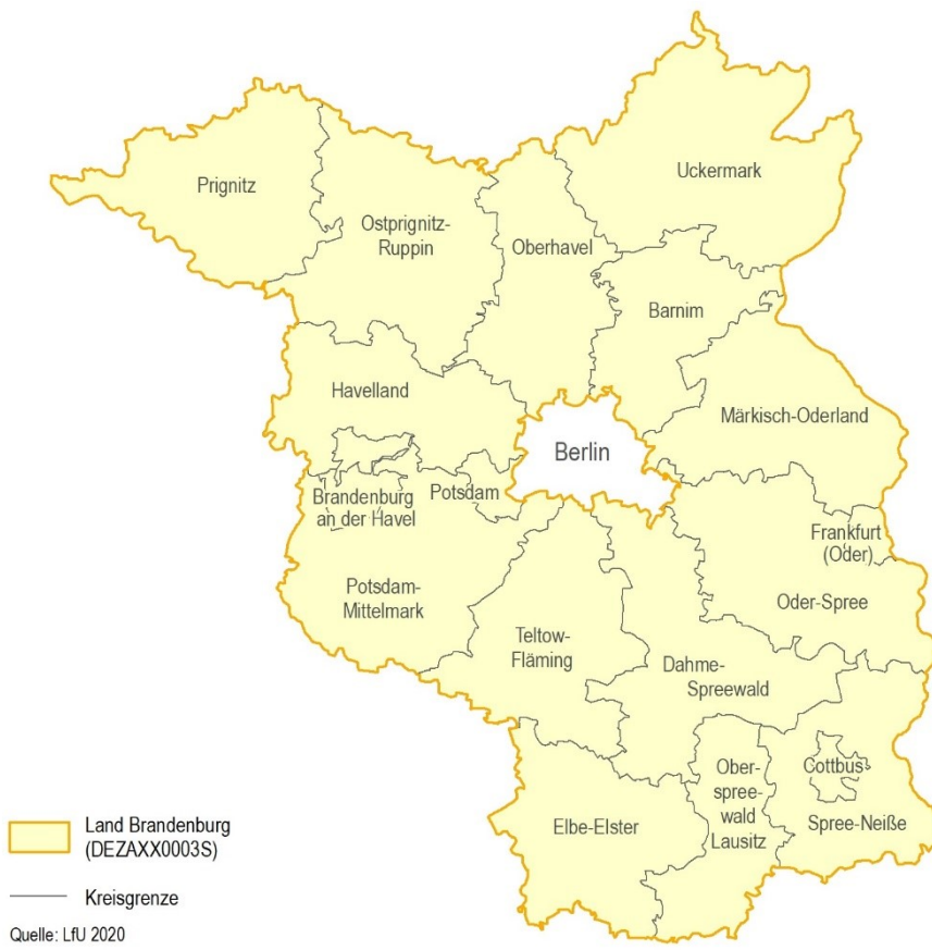
Abbildung 2 Beurteilungsgebiete für die Luftschadstoffe Stickstoffdioxid, PM10 und PM2,5