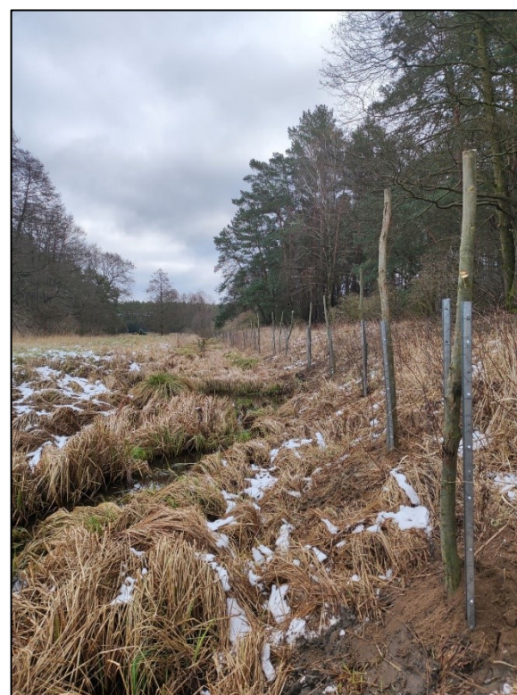
Eingebraachte Setzstangen mit Verbisschutz