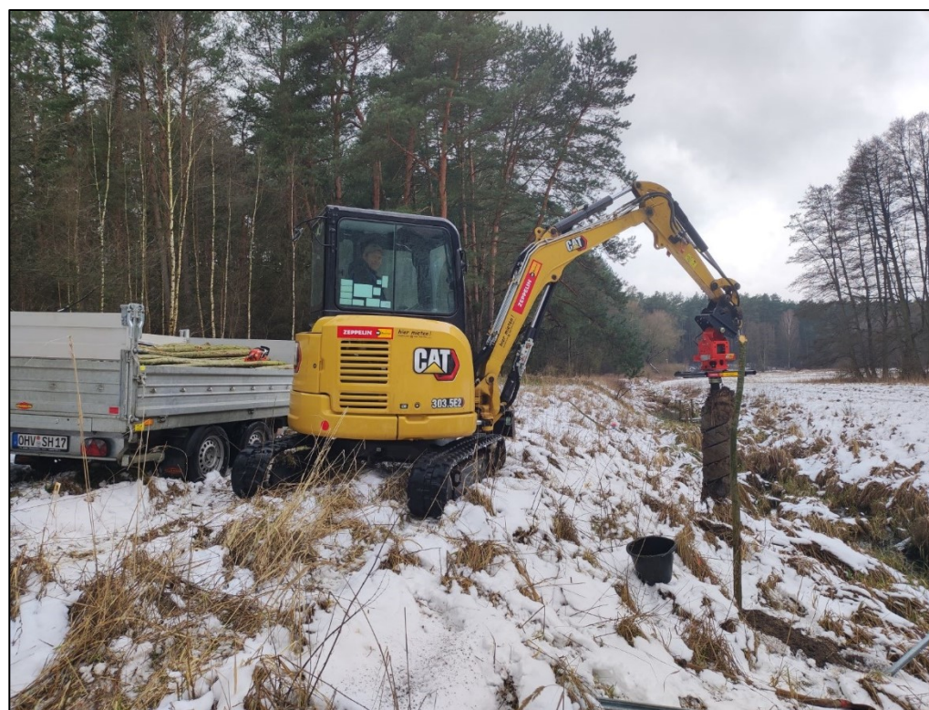
Bagger beim Bohren der Setzlöcher