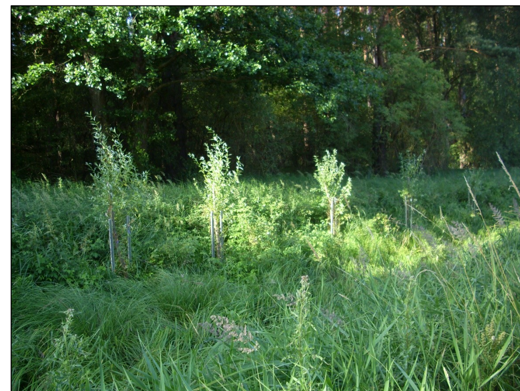
Nach dem Austrieb im Juli 2023