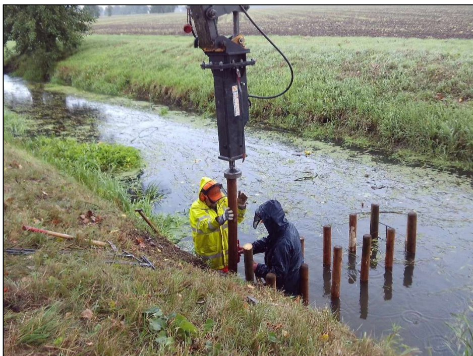
Rammen von Pfählen mit Hydraulikhammer