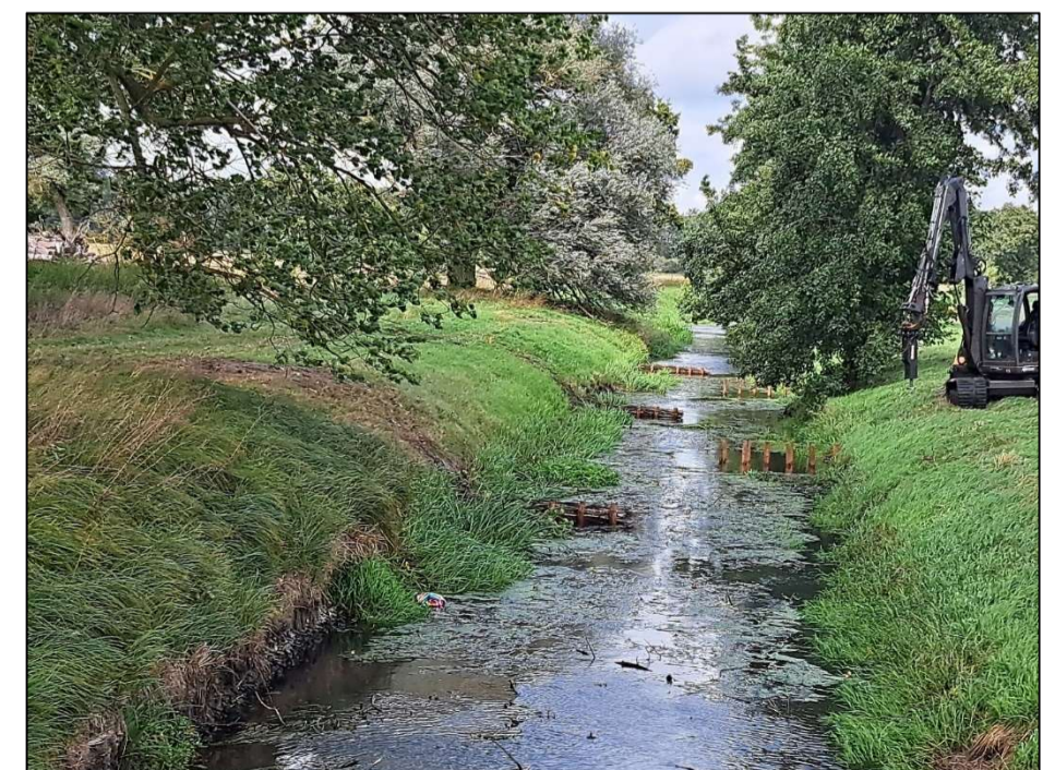
Blick gegen die Fließrichtung, Buhnen rechts noch im Bau

Alle Fotos zeigen einen bauzeitlich stark abgesenkten Wasserstand. Die Bauhöhe der Buhnen liegt unter Mittelwasser.