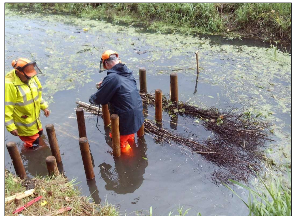
Einlegen der Nachbettsicherung