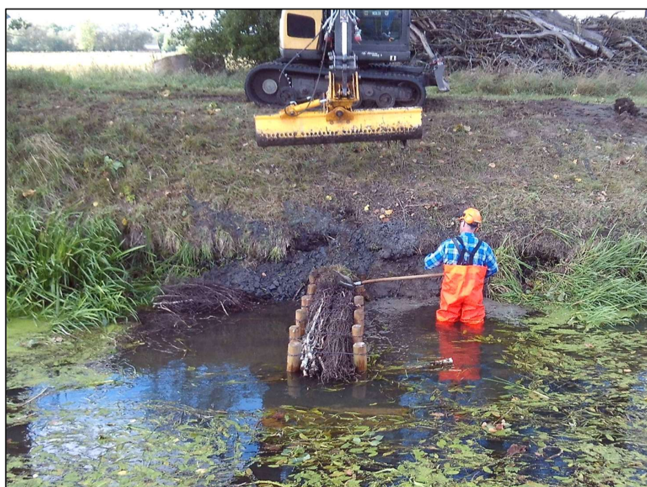
Wiederverfüllen der Böschung mit Wasserbausteinen