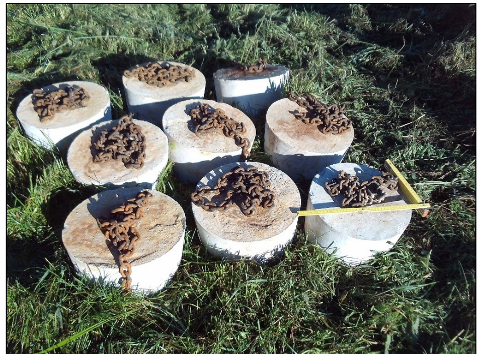
Ankersteine zur Auftriebssicherung, 3 Paare je Stangenholz Bündel