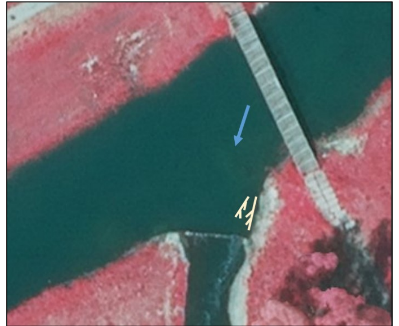
Schemazeichnung im Infrarotluftbild