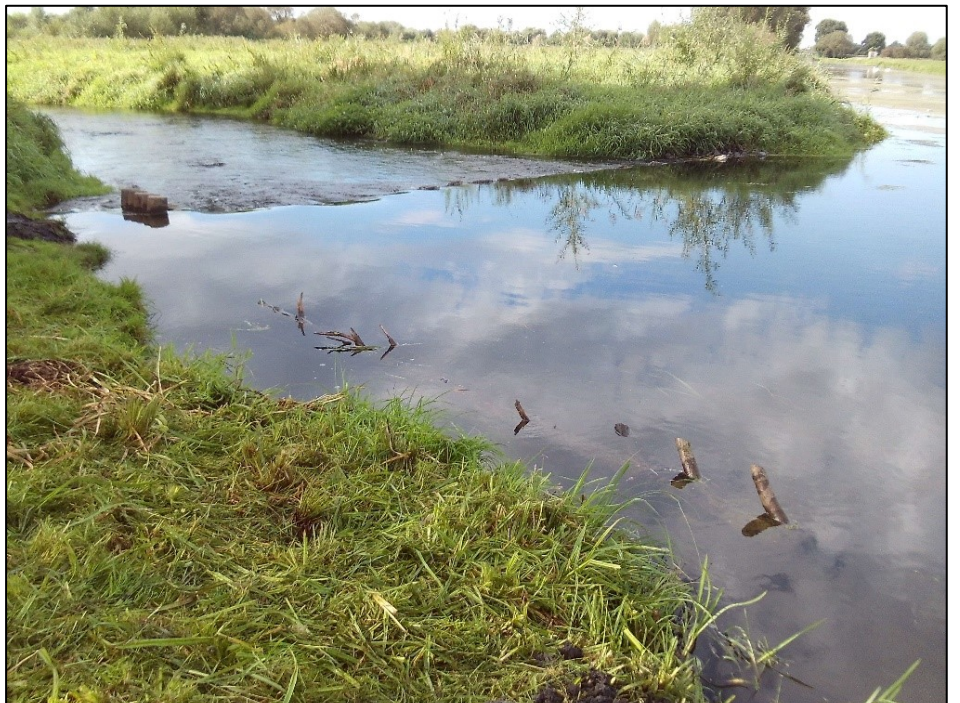
Fertiger Einbau, an der Oberfläche ist nur ein Bündel sichtbar.