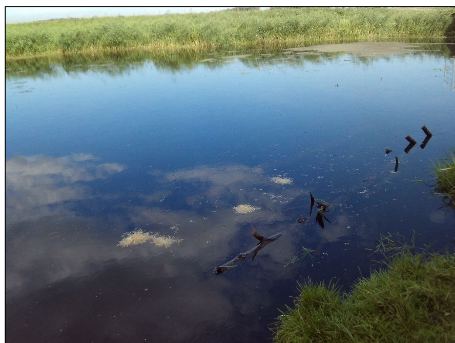
Visualisierung der Oberflächenströmung mit Hobelspänen