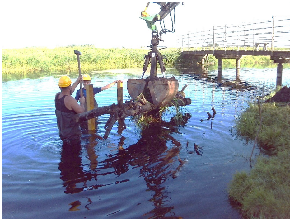
Einbau des zweiten Stangenholz Bündels, Pfähle sind nur Baubehelf