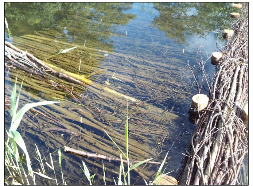
Nachbett: Lebensraum für Jungfische und Kleinlebewesen