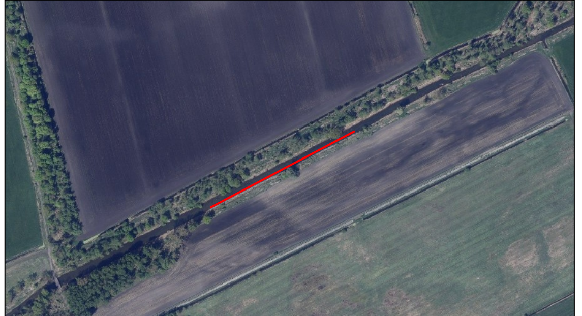
Luftbild mit Einbaustrecke