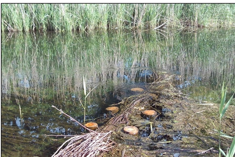
Strömungsdiversität: beruhigt rechts, verwirbelt oben im Bild