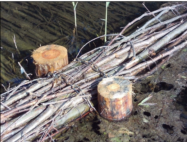
Befestigung an Pfählen mit Ketten