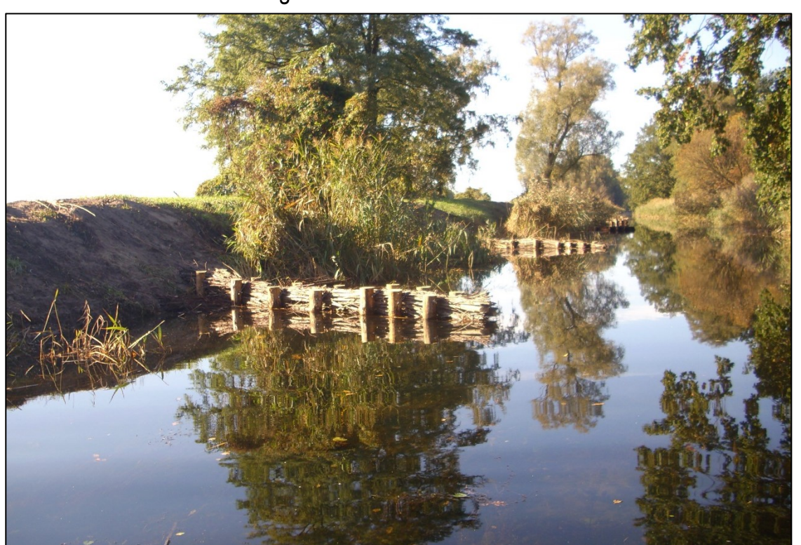
Fertige Buhnen bei sehr niedrigem Wasserstand (Buhnenoberkanten auf Mittelwasser-Niveau)