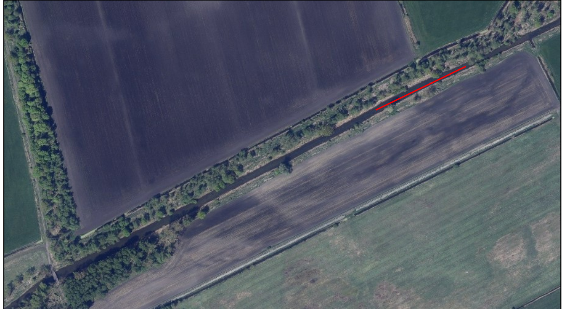
Luftbild mit Einbaustrecke