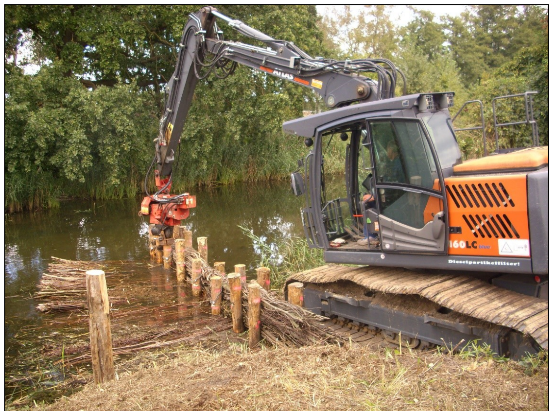
Buhne mit Nachbettsicherung aus Faschinen im Bau