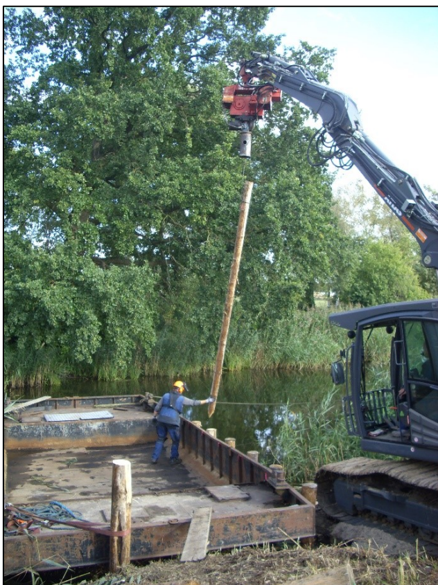
Einheben eines Pfahls zum Rammen