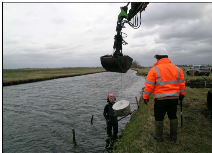
Setzen eines Ankersteins bei abgesenktem Wasserstand, Pfähle sind nur Baubehelfe