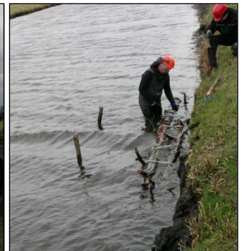
Einbau eines Stammbündels bei abgesenktem Wasserstand