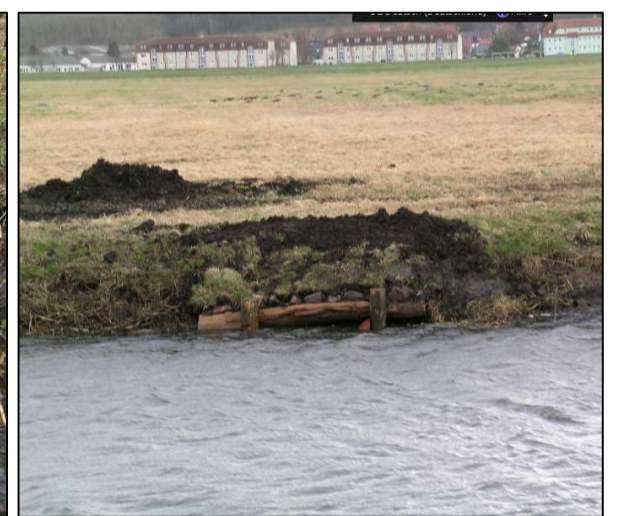
Wiederverfüllte Böschung bei abgesenktem Wasserstand