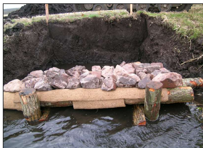
Kokosfiltermatte und Auftriebssicherung mit Steinen bei abgesenktem Wasserstand