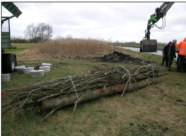
Baumaterial: Stämme mit Astansätzen und Reisig gebündelt, im Hintergrund links Ankersteine