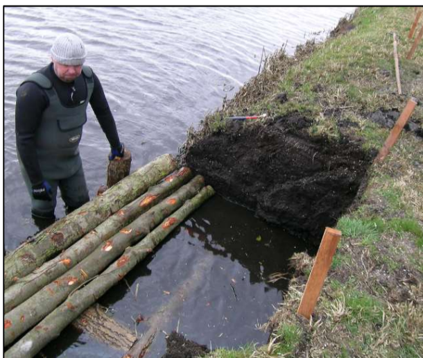
Bau des Holzgerüsts in der abgetragenen Böschung bei abgesenktem Wasserstand