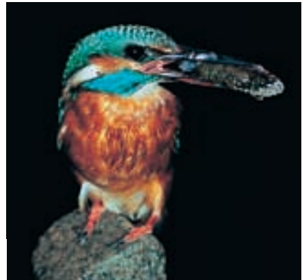
Abb. 5 Eisvogel ( Alcedo atthis )

Eine Art (Waldwasserläufer) wurde korrekterweise in die Kat. R eingeordnet.