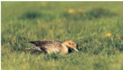
Abb. 2 Spießente ( Anas acuta )