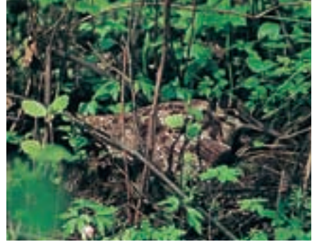
Abb. 7 Waldschnepfe ( Scolopax rusticola )