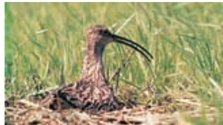
Abb. 3 Großer Brachvogel ( Numenius arquata )