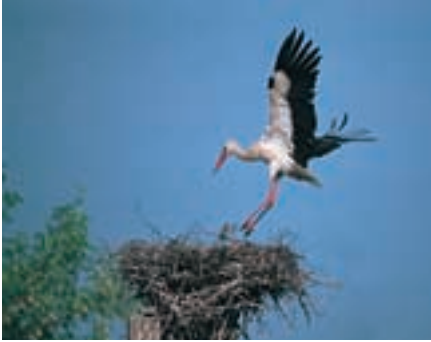
Abb. 6 Weißstorch ( Ciconia ciconia )