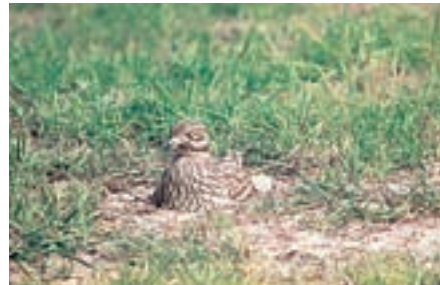
Abb. 1 Triel ( Burhinus oedicnemus )

Im aktuellen Zeitraum sind Moorente und Triel ausgestorben und mußten von der Kat. 1 in die Kat. 0 hochgestuft werden.