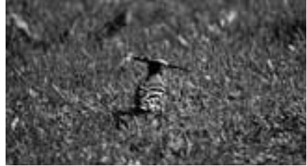
Abb. 4 Wiedehopf ( Upupa epops )

Eine Art (Haselhuhn) konnte nach Wiederansiedlung (mit mind. 3 Brutjahren) aus der Kat. 0 nach 1 abgestuft werden, während 2 Arten von der Kat. 1 nach 0 hochgestuft wurden (s. unter Kat. 0).