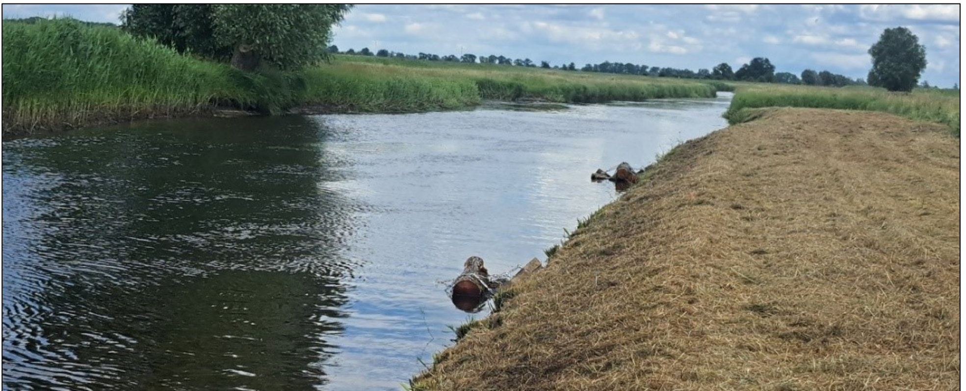
Zwei von zehn Stammholzbindeln, die am Böschungsfuß eingebaut wurden.